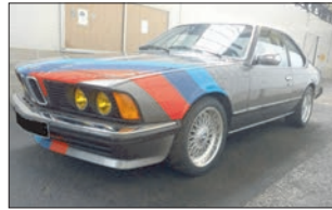
BMW 635 CSI E 24 GROUP 1 1979 Vends BMW 635 CSI E24 Groupe 1 . Vient avec son passeport FIA de régularité. Expertisée. Idéale pour les rallyes de régularité ou les courses sur circuit du Groupe 1 Tél : 0611980980 automobilia@orange.fr Prix : 30 000 €.