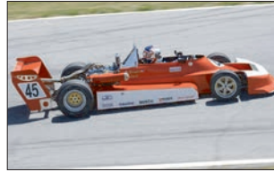
MARCH 80A 1980 Vends March 80A, Formula Atlantic de 1980. 2 propriétaires depuis son origine. Pilotée par Danny Sullivan. Restaurée de A à Z. Prête à courir. Tél : 509-868-2034 GSM : +1 15 098 682 034 ricksminis1@msn.com Prix : 49 900 €.