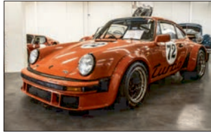
PORSCHE 911 1985 Vends Porsche 930 turbo 3.3l Groupe 4 1985. Grosse préparation, moteur neuf 400cv. Nombreuses options possibles Tél : +33 553 997 426 secretariat.speedclassic@gmail.com Prix : 120 000 €.