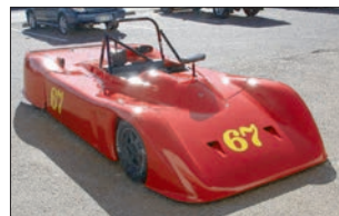
SWIFT DB5 Vends SWIFT DB5 Sport 2000. Rapide et fiable. Parfaitement entretenue. Prête pour la saison à l'exception du harnais pilote à remplacer. Tél : (765)335-2057 info@indycompetition.com Prix : 35 500 €.