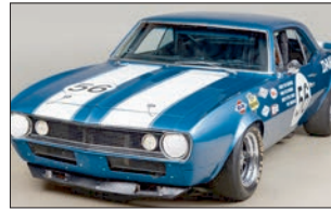
CHEVROLET CAMARO 1967 Vends Chevrolet Camaro Trans-Am "Dana" . Restaurée de A à Z selon les specs période 1967. Historique limpide. Un morceau de l'histoire de la Trans-Am. Tél : 1 831 430 9940 info@canepa.com Prix : PSD.