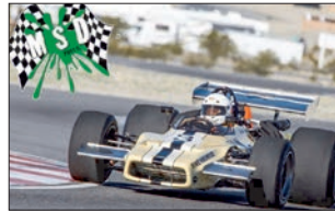
LOLA T190 Vends Lola T190 de Formule 5000. Châssis #HU-15. Il s'agit de la voiture que Mike Hailwood a pilotée dans le championnat 1970 de F5000. Intégralement restaurée. Tél : 509-868-2034 GSM : +1 15 098 682 034 ricksminis1@msn.com Prix : 133 000 €.