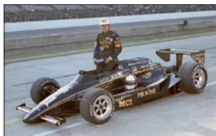
LOLA T8600 Vends Lola T8600 Hu05. pilotée par Arie Luyendyk aux 500 Miles d'Indianapolis 1986. Voiture complète et non restaurée - Très rare - Pour plus de renseignements, n'hésitez pas à nous contacter. Tél : (765)335-2057 info@indycompetition.com Prix : 111 150 €.