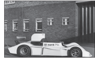
MARCH ST 77 1977 Vends March 77 ST. Historique limpide. Restauration totale en cours avec possibilité pour le nouveau propriétaire de choisir sa définition parmi l'une des 3 qui ont été les siennes : ST75, ST77 ou March 802. Tél : (765)335-2057 info@indycompetition.com Prix : PSD.