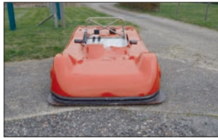
TIGA SC87 1987 Vends Tiga Sport 2000 de 1987. Ford Pinto. Peut être la plus rapide des S2000 actuellement sur le marché. Complètement restaurée, et prête à courir. Tél : 00447971888464 chris@baileysttravel.co.uk Prix : 29 000 €.