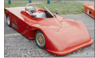
TIGA SC79 1979 Vends TIGA Sport 2000 historique (GHI). Restaurée il y a peu. éligible pour toutes les séries S2000 "WorldWide". Convient aux pilotes de toute taille. Prête à courir. Tél : 00447971888464 chris@baileysttravel.co.uk Prix : 36 000 €.