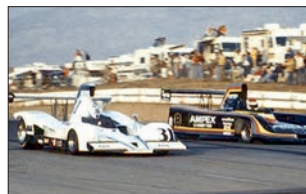
LOLA T332 1975 Vends Lola T332 Hu53 ex F5000 recarrossée en CanAm Frisbee. Très bel historique. Moteur et réservoir neufs. Très performante et peu coûteuse à utiliser. Tél : (765)335-2057 info@indycompetition.com Prix : 155 500 €.