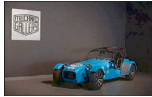
CATERHAM SUPER SEVEN 1998 Vends CATERHAM SUPER SEVEN - SEVEN ACCESS de 1998. Disponible à l'achat et à la location. Moteur Fiat 1600cc. 105cv pour 480kg. Éligible dans le cadre du Trophée Lotus, au sein de l'Historic Tour FFSA. Tél : +33 474 025 745 contact@mecanickgallery.com Prix : 15 900 €.