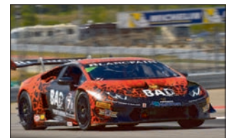
LAMBORGHINI HURACAN 2014 Vends Lamborghini Huracan super trofeo. Modèle très compétitif dans sa catégorie, vendu avec quelques pièces. Tél : (765)335-2057 info@indycompetition.com Prix : 156 600 €.