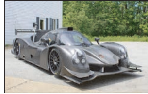
LIGIER P3 2017 Vends Ligier JS P3 IMSA LMP3. 2017. Upgrades 2018. Joli lot de pièces. Tél : (765)335-2057 info@indycompetition.com Prix : 210 000 €.